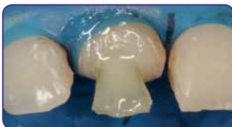
Fertigstellung des Stumpfaufbaus