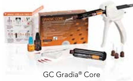
GC Gradia® Core