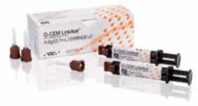
GC G-CEM LinkAce®