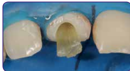
Zusätzliche Wurzelstifte hinzufügen, um den übrigen Raum zu füllen und zu verdichten