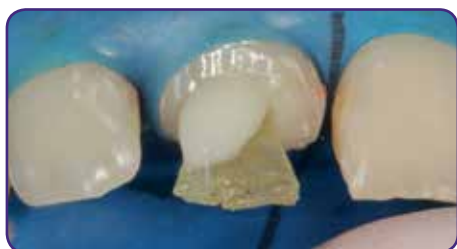
Wurzelstift einsetzen und anhärten