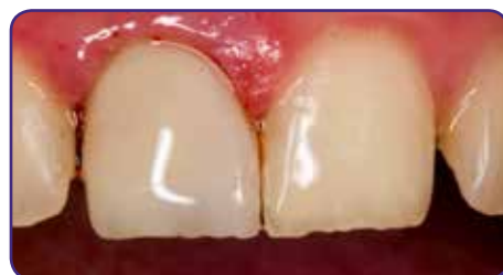
Ergebnis nach Abdeckung mit einer Compositeschicht G-aenial Anterior